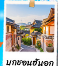
มูกชอนฮันจอก