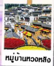
หมู่บ้านทวงหลิง