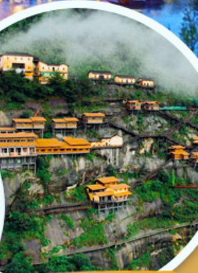
หมู่บ้านทวงหลิง