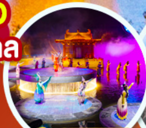
ชมโชว์อุทนีโจว