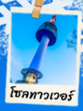
โซลทาวเวอร์