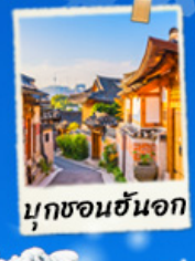
มุกซอนฮันอก