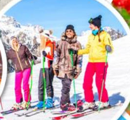
เล่นสกีจุใจ