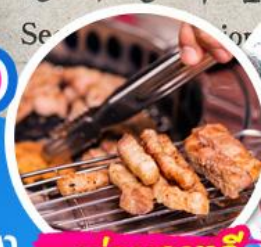
เมนูย่างเกาหลี