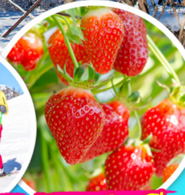
ไรสตรอว์เบอร์รี่