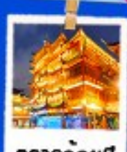
ตลาดร้อยปี