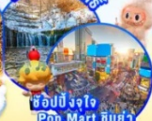
ช้อปปิ้งจ๊อ Pop Mart ชิบูย่า