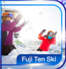
Fuji Ten Ski