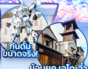
กินดื่ม ขนาดจริง!