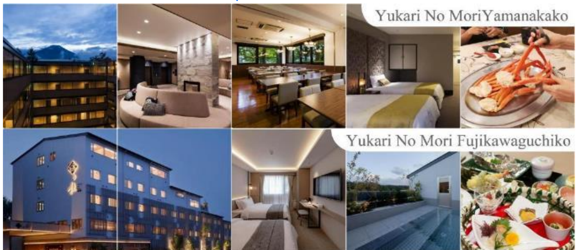
Yukari No Mori Yamanakako