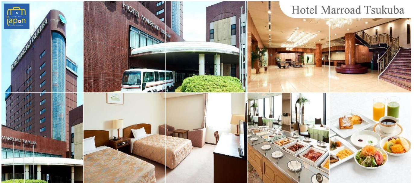
Hotel Marroad Tsukuba

ได้เวลาอันสมควรนำท่านเดินทางสู่ เมืองสีคบุะ (Tsukuba) (ใช้เวลาเดินทางประมาณ 1 ชั่วโมง) รับประทานอาหารเย็น ณ ภัตตาคาร (1) HOTEL MARROAD, TSUKUBA หรือระดับเดียวกัน