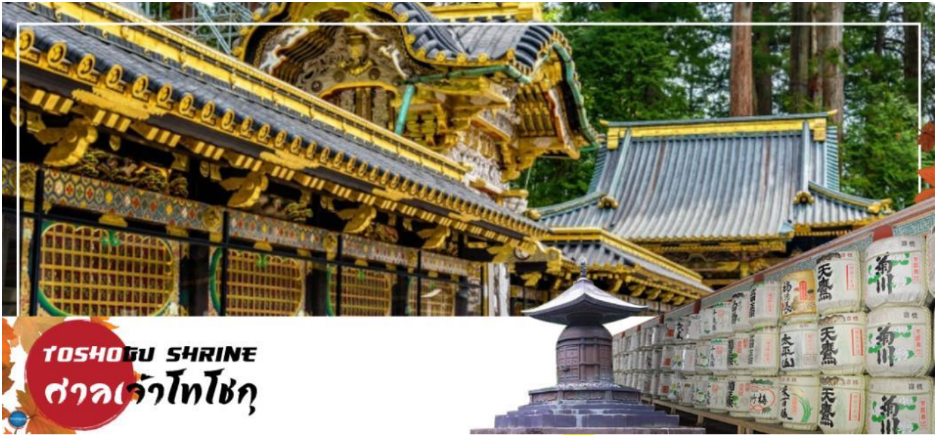
TOSHOGU SHRINE ศาลเจ้าโทโชกุ

วันที่สาม เมืองนิกโกะ – ผ่านชม สะพานชินเคียว – ศาลเจ้าโทโชกุ – ศาลเจ้าฟูตาระ – จังหวัดไซตามะ – ย่านเมืองเก่าคาวะโกเอะ – ดรอกลูกกวาด – เมืองยามานาชิ – ออนเซ็น + ชาบูยักษ์