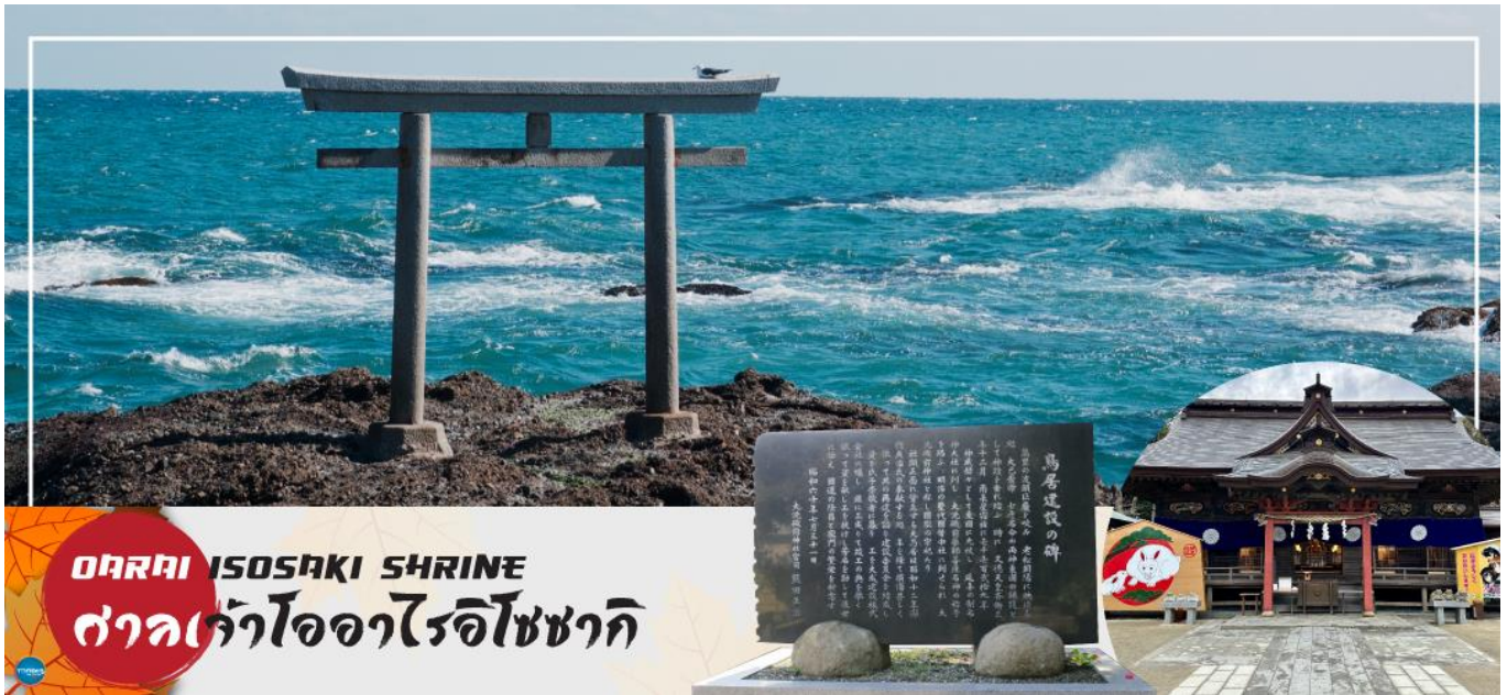
OTORI ISOSAKI SHRINE ศาลเจ้าโออิวาไรอิโซซากิ

ของเทพเจ้าโอนามิจิโนะมิโคโตะ และ เทพเจ้าสึคนะฮิโคะโนะมิโคโตะ สร้างขึ้นตั้งแต่ 29 ธันวาคม ค.ศ.856 รวมทั้งยังเป็นจุดถ่ายรูปพระอาทิตย์ขึ้นที่มีชื่อเสียง มีนักท่องเที่ยวมากมายมาเฝ้าคอยเพื่อเก็บภาพช่วงเวลาแสงตะวันสาดส่องขึ้นสู่ขอบฟ้า