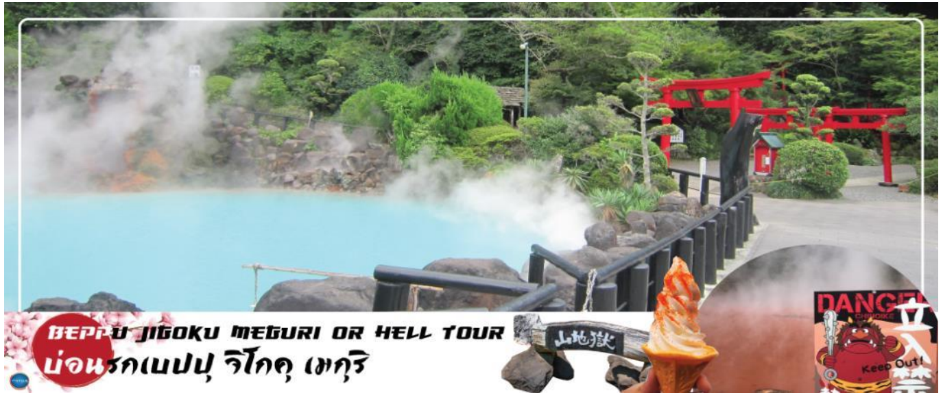
BEPPU JIGOKU MEGURI OR HELL TOUR บ่อนรกเบปปุ จิโกคุ เมกุริ

วันที่สาม เมืองเบปปุ – บ่อนรกเบปปุ จิโกคุ เมกุริ (เข้าชม 2 บ่อ) – เมืองยุฟูอิน – หมู่บ้านยุฟูอิน ทะเลสาบคิริน – เมืองฟุกุโอกะ – ศาลเจ้าอะไซฟูเทมมังกุ – ดิวตี้ฟรี – กันดั้ม ปาร์ค ฟุกุโอกะ