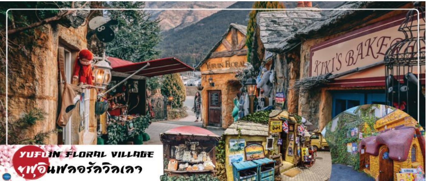
YUFUIN FLORAL VILLAGE หมู่บ้านฟลอร์วิลเลจ

นำท่านสู่ บ่อนรกเบปปุ จิโกคุ เมกุริ (Beppu Jigoku Meguri Or Hell Tour) หรือบ่อน้ำพุร้อน ขุนมรกตทั้งแปด เป็นบ่อน้ำพุร้อนธรรมชาติที่เกิดขึ้น ภายหลังจากการระเบิดของภูเขาไฟ ประกอบไปด้วยแร่ธาตุที่เข้มข้น เช่น กำมะถัน แร่เหล็ก โซเดียม คาร์บอนเนต เรเดียม เป็นต้น และร้อนเกินกว่าจะลงไปอาบได้ แล้วบ่อทั้ง 8 บ่อ ก็ตั้งชื่อให้แปลกตามลักษณะภายนอกที่เห็น (ให้ท่านเข้าชม 2 บ่อ) นำท่านสู่ เมืองยุฟูอิน (Yufuin) เมืองเล็กๆ ในจังหวัดโออิตะ (Oita) ที่รู้จักกันดีในฐานะแหล่งออนเซ็นชื่อดัง และที่นี่ก็เต็มไปด้วยสถานที่น่ารักๆ มีถนนที่เรียงรายไปด้วยคาเฟ่และร้านขายของเก๋ ของกระจุกกระจิกมากมาย ระหว่างทางไม่ควรพลาดที่จะแวะ ยุฟูอิน ฟลอร์วิลเลจ (Yufuin Floral Village) อิมปาร์คในบรรยากาศแห่งเทพนิยายที่ดูราวกับกำลังหลงเข้าไปในเหมือนจำลองหมู่บ้านสไตล์ยุโรป ร้านค้าทุกหลังเป็นสีเหลืองที่มีแต่ร้านที่มีสินค้าเป็นเอกลักษณ์ !!!ไฮไลท์ ประจำเมืองยุฟูอิน บ้านอิฐที่แสนคลาสสิกเรียงรายอยู่บนถนนสายเล็กๆ ประดับประดาไปด้วยดอกไม้บานาชนิด ภายในหมู่บ้านมีถนนช้อปปิ้ง มีร้านรวงต่างๆ ที่ตกแต่งได้อย่างน่ารัก ร้านไอศกรีม หรือ คาเฟ่ต่างๆ อย่าง Alice Tea คาเฟ่สุดชิคบรรยากาศเหมือนอยู่ในป่าและจับน้ำชากับ Mad Hatter หรือจะเป็นร้านขนม ที่มีเค้กวานิลจาก Kiki's Delivery Service กลิ่นหอมของขนมปังอบอวล น่ากินสุดๆ นอกจากนี้ยังมี จุดพักผ่อนให้ผ่อนคลายเช่นเก้าอี้มากมาย เดินเลยจากถนนช้อปปิ้งไปท่านจะได้พบความงามของ ทะเลสาบคิริน (Kirin Lake) น้ำทะเลสาบใสเห็นตัวปลาแหวกว่ายในผืนน้ำ บางช่วงมีหมอกบางๆ ลง นับว่าคุ้มค่ากับการมาเห็นความงามนี้ด้วยตาตัวเองสักครั้งนึงอย่างแน่นอน อิสระให้ท่านเดินเล่นและถ่ายรูปตามอัธยาศัย