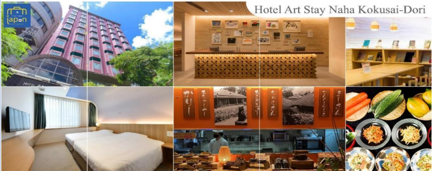
Hotel Art Stay Naha Kokusai-Dori

ที่พักร HOTEL ART STAY NAHA KOKUSAI-DORI หรือเทียบเท่า