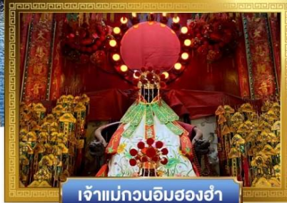
เจ้าแม่กวนอิมสองห้า