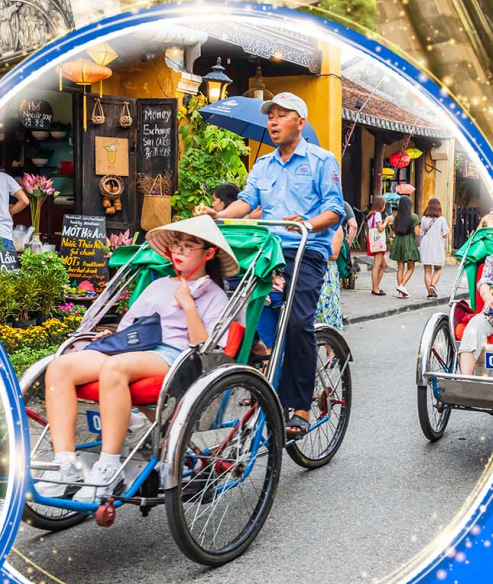
นั่งรถสามล้อซิโคล