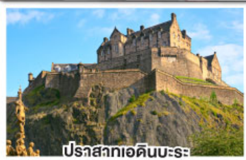
ปราสาทเอ็ดินเบิร์ก

เยือนสโตนเฮนจ์ และ พิพิธภัณฑน์โรมันโบราณ