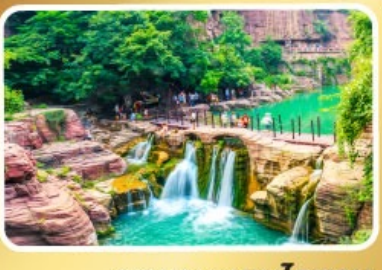
อุทยานหยุ่นโกซ่าน