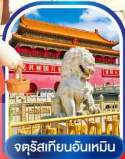
จตุรัสเทียนอันเหมิน