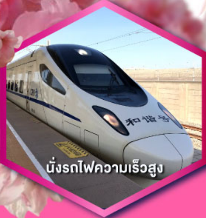
นั่งรถไฟความเร็วสูง