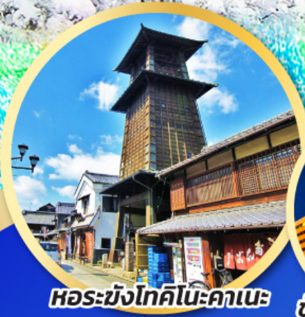
หอรบั้งโทคิโนะคานะ