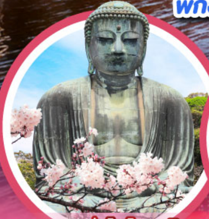
หลวงพ่อดโต ไดบุตสึ