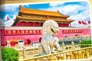
จตุรัสเทียนอันเหมิน