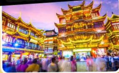
ตลาดร้อยปีเจิ้งหวิงเมี่ยว