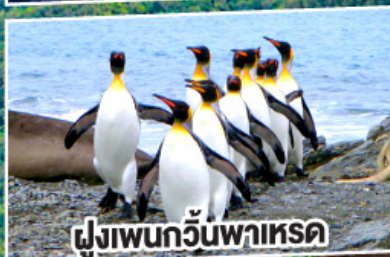
ฝูงเพนกวินพาเหรด