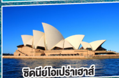
ซิดนีย์โอเปร่าเฮาส์