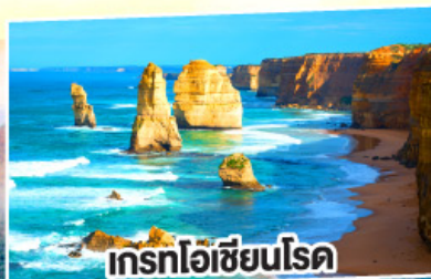
เกรทโอเซียนโรด