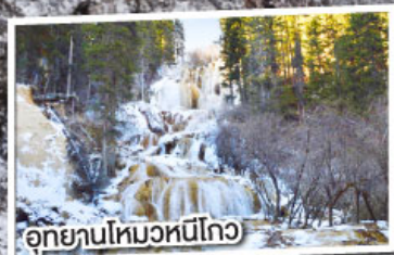
อุทยานโหมวหนีโกว