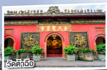
วัดต้าถื่อ