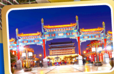
ถนนโบราณเทียนเหมิน