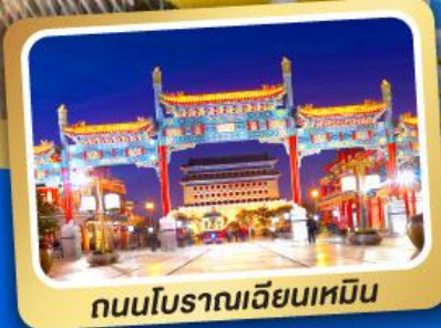
ถนนโบราณเทียนเหมิน