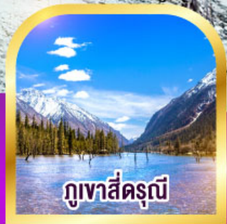
ภูเขาสี่ตระกูล