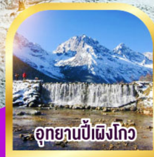
อุทยานป่าเผิงโกว