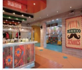
EL LOCO FRESH