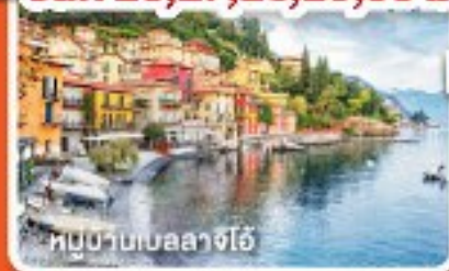
หมู่บ้านเบลลาจีโอ