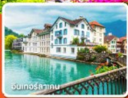
อินทอร์ลาเกน