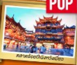
ศาลาร้อยปีปักกิ่งหวงเหมียว