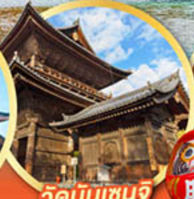
วัดนินเซินจิ