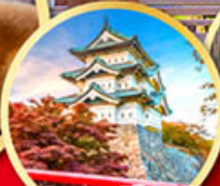
ปราสาทอิโรฮาเกะ