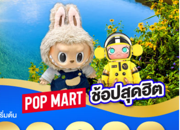
POP MART ซ้อปสุดฮิต