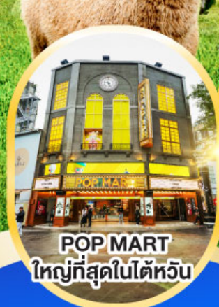
POP MART ใหญ่ที่สุดในไต้หวัน

ฟรี ประกัน สุขภาพ และอุบัติเหตุ และอุบัติเหตุ ไทยวิวัฒน์ GTIP Plus (Gold Plan) 3 ล้านบาท คุ้มครองสูงสุด *เงื่อนไขขึ้นอยู่กับเงื่อนไขกำหนด ความคุ้มครองเป็นไปตามกรมธรรม์ประกันภัย 5วัน3คืน