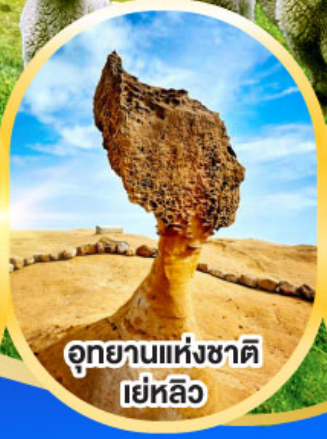
อุทยานแห่งชาติ เย่หลิว