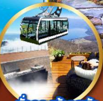
นังกระเข้าอุซัง

พิเศษ!! บัฟเฟ่ต์ร้าน NANDA ดีที่สุดในชิปปโปโร