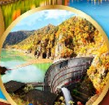
เขื่อนไฮเฮเคียว