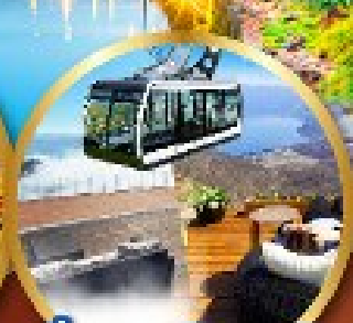
นังกระเช้าอุซุซัง

พิเศษ!! บุฟเฟ่ต์ร้าน NANDA ดีที่สุดในซัปโปโร