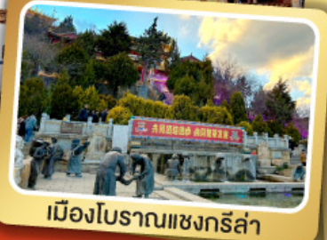
เมืองโบราณแชนกรีล่า