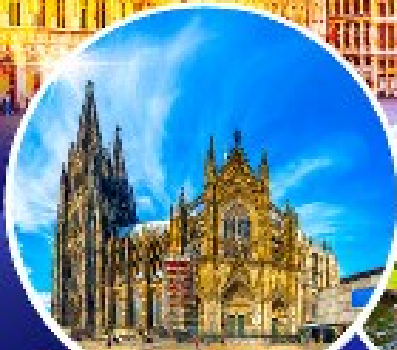
มหาวิหารแห่งโคโลญ