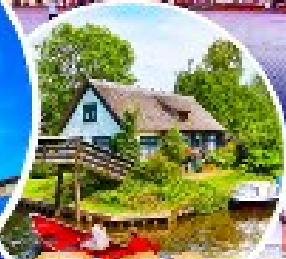
หมู่บ้านกีร์ช