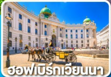
ฮอฟบิรท์เวียนนา