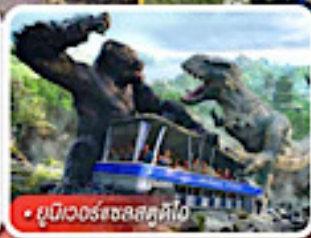
ยูนิเวอร์แซลสตูดิโอ