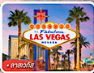
ลาสเวกัส