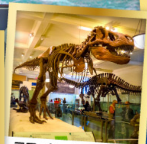
พิพิธภัณฑ์ธรรมชาติ