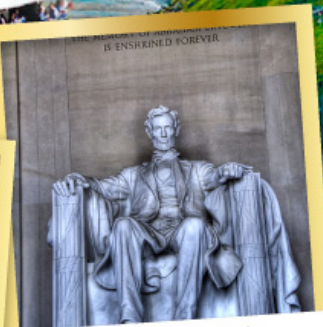
ลินคอร์นเมมโมเรียล