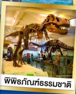
พิพิธภัณฑ์ธรรมชาติ