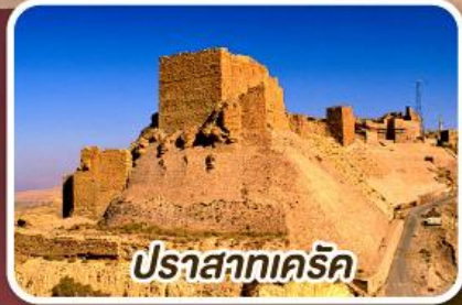
ปราสาทเครีค