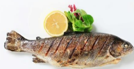
พิเศษ!! ปลาเทราต์ย่าง

เกียง ๑๑ รับประทานอาหารเที่ยง (มื้อที่3) เมนูพิเศษ ปลาเทราต์ย่างท่านละ 1 ตัว นำท่านเดินทางสู่ เมืองลินซ์ (Linz) (ระยะทาง 125 กม./ 2 ชม.) เป็นเมืองที่มีการผลิตเหล็ก เครื่องจักร อุปกรณ์ไฟฟ้า อดีตเป็นศูนย์กลางการค้าที่สำคัญ ให้ท่านถ่ายรูปบริเวณด้านนอก พิพิธภัณฑ์แห่งโลกอนาคต (Ars Electronica Center) ตั้งอยู่ริมแม่น้ำดานูบ เป็นที่จัดแสดงวิทยาการต่างๆ ที่ส่งผลต่อมวลมนุษยชาติปัจจุบัน ไม่ว่าจะเป็นอวกาศ หุ่นยนต์และเอไอ ยารักษาโรค เป็นต้น