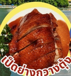
เป็ดย่างกวางตุ้ง