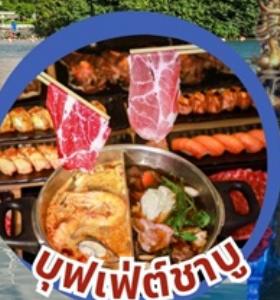
บุฟเฟต์ซาบู