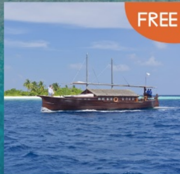
Safari Boat Trip