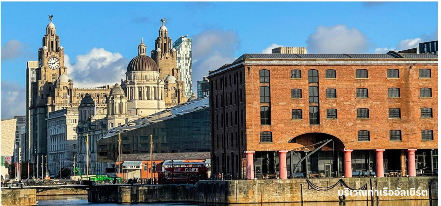
บริเวณท่าเรืออัลเบิร์ต

ออกเดินทางสู่ ดูไบ ประเทศสหรัฐอาหรับเอมิเรตส์ โดยสายการบินเอมิเรตส์ เที่ยวบินที่ EK020 (บริการอาหารและเครื่องดื่มบนเครื่องบิน)