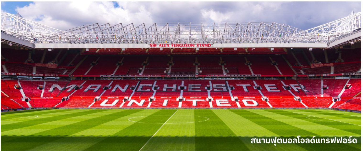
สนามฟุตบอลโอลด์แทรฟฟอร์ด

ให้ท่านได้เที่ยวชมส่วนต่างๆของสนามละประวัติความเป็นมาของสโมสรแห่งนี้ จากนั้นอิสระให้ท่านเลือกซื้อของที่ระลึกของทีมสโมสรแมนเชสเตอร์ยูไนเต็ด ในร้าน MEGA STORE ที่มากมายไปด้วยของที่ระลึกหลากหลายชนิดสำหรับแฟนบอล