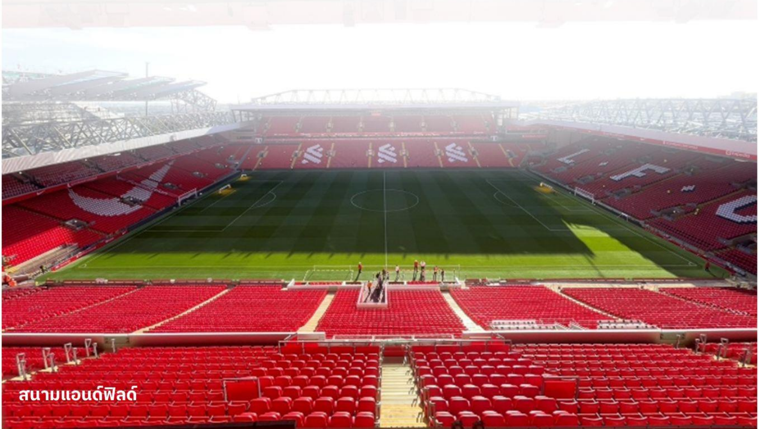
สนามแอนฟิลด์

หนึ่งในสถานที่ท่องเที่ยวที่ใหญ่ที่สุดในเมืองลิเวอร์พูล โดยบริเวณท่าเรือนี้ประกอบไปด้วยอาคารท่าเรือและคลังสินค้า นอกจากนี้แล้วท่าอัลเบิร์ตยังเป็นสถานที่ท่องเที่ยวที่มีคนเข้าชมมากที่สุดในสหราชอาณาจักรอีกด้วย