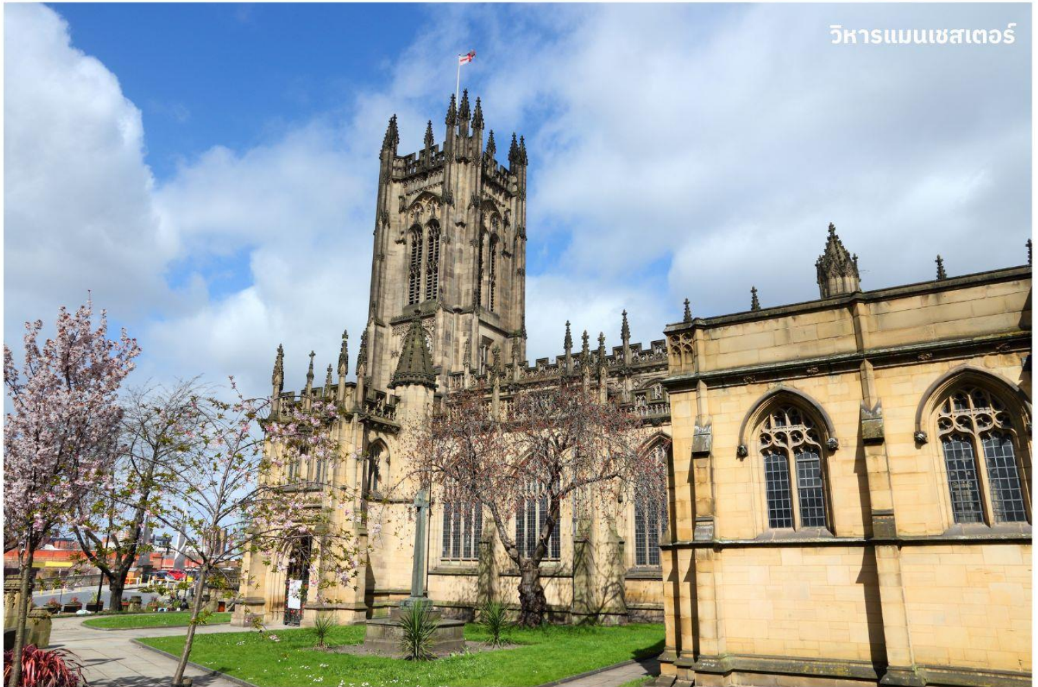
วิหารแมนเชสเตอร์

สร้างขึ้นมาตั้งแต่ปี ค.ศ. 1215 โดยบาร์อนโรเบิร์ต เกรสเล็ท เจ้าของคฤหาสน์แมนเชสเตอร์ สั่งให้สร้างขึ้นมาข้างกับที่พักของเขา เพื่อใช้เป็นโบสถ์ประจำเขตศาสนาของเมืองแมนเชสเตอร์ ได้รับความเสียหายอย่างหนักจากระเบิดในสงครามโลกครั้งที่ 2 และเมื่อในปี ค.ศ. 1996 ได้ถูกลอบวางระเบิดจากผู้ก่อการร้าย ไออาร์เอ ทำให้ต้องมีการบูรณะใหม่อีกครั้ง แต่ปัจจุบันนั้นก็กลับมาสวยงามดังเดิม และใช้ประกอบพิธีกรรมทางศาสนา รวมทั้งเป็นส่วนหนึ่งของ Church of England ที่หากมาถึงประเทศอังกฤษ