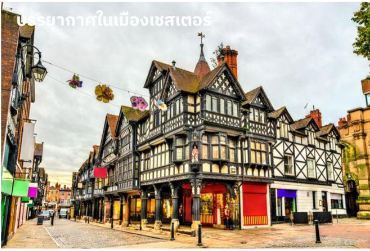
บรรยากาศในเมืองเชสเตอร์

จากนั้นนำท่านเดินทางสู่ เมืองเชสเตอร์ (Chester) ใช้เวลาเดินทางประมาณ 1 ชั่วโมง เชสเตอร์เมืองเก่าที่ค้นพบโดยชาวโรมันเมื่อประมาณ 2,000 ปีมาแล้ว นำท่านผ่านชมตัวเมืองอันสวยงาม ทางตอนเหนือของแคว้นเวลส์ ลักษณะของสถาปัตยกรรมของอาคารบ้านเรือนเป็นแบบทิวดอร์ อันเป็นเอกลักษณ์เฉพาะของที่นี่โครงสร้างตึกและบ้านเรือนที่จะทำจากไม้และทาสีขาวดำซึ่งจะเห็นได้ทั่วไปแทบจะทุกถนน ซึ่งเสริมให้บรรยากาศของเมืองนี้มีเสน่ห์ และแฝงความน่ารักเอาไว้ นอกจากนี้ตึกบางแห่งยังเป็นตึกเก่าแก่ตั้งแต่สมัยปี ค.ศ.1488 อีกด้วย