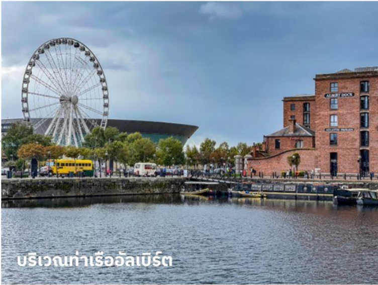
บริเวณท่าเรืออัลเบิร์ต

ได้เวลาอันสมควรนำท่านสู่สนามบิน เพื่อเตรียมตัวเดินทางกลับประเทศไทย