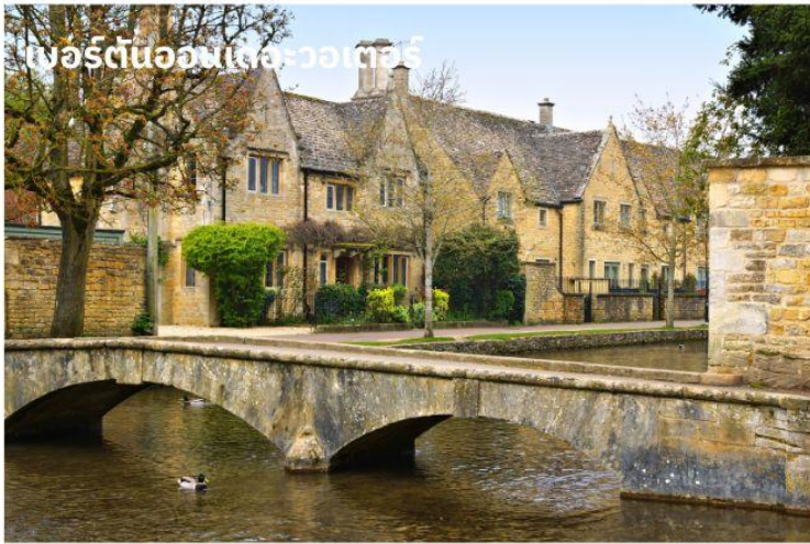
เบอร์ตันออนเดอะวอเตอร์