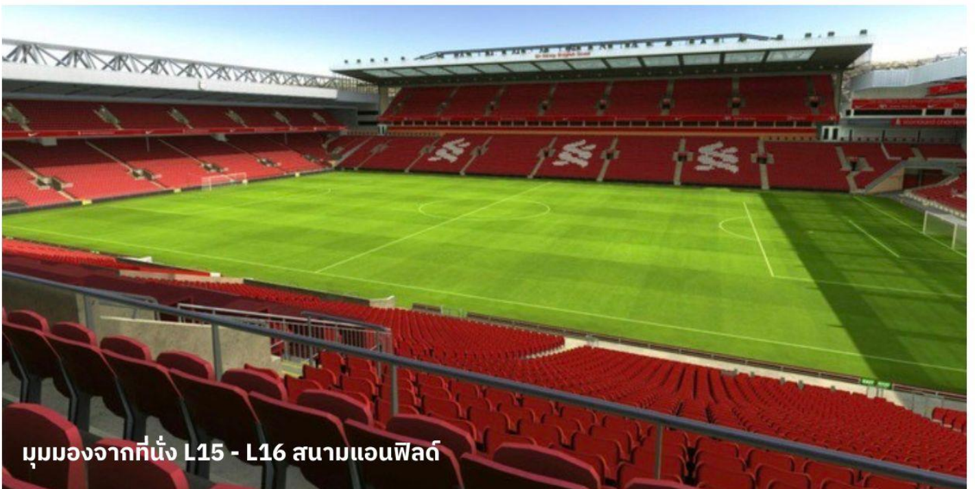
มุมมองจากที่นั่ง L15 - L16 สนามแอนฟิลด์

นำท่านเข้าสู่ที่พัก Mercure Liverpool Atlantic Tower Hotel หรือเทียบเท่า