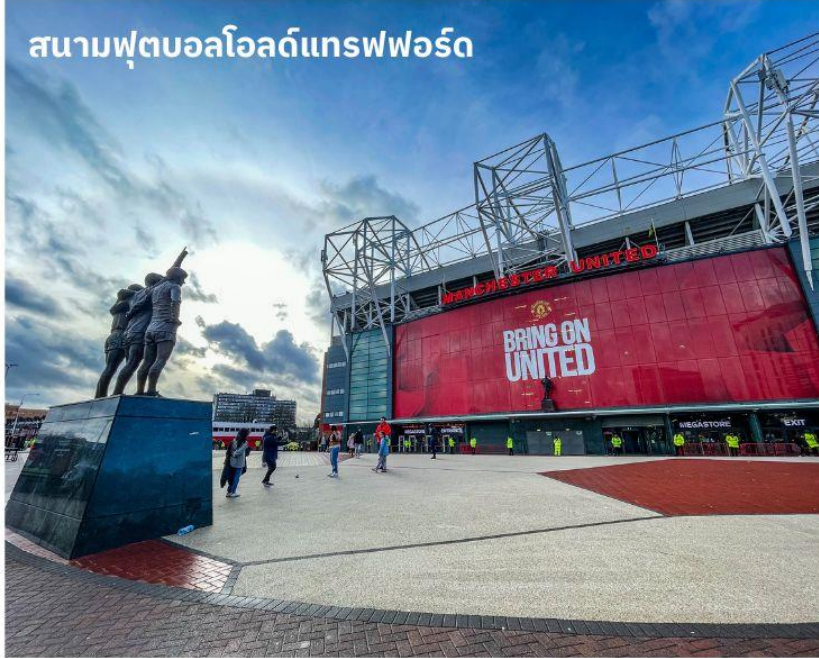
สนามฟุตบอลโอลด์แทรฟฟอร์ด

จากนั้นนำท่านเดินทางสู่ เมืองแมนเชสเตอร์ ใช้เวลาเดินทางประมาณ 1 ชั่วโมง เป็นอีกหนึ่งเมืองท่าที่สำคัญของประเทศอังกฤษและยังเป็นเมืองที่มีประชากรมากที่สุดเป็นอันดับสองของประเทศอังกฤษ รองจากมหานครลอนดอน จากนั้นนำท่านถ่ายรูปด้านหน้า สนามฟุตบอลโอลด์แทรฟฟอร์ด แห่งทีมแมนเชสเตอร์ ยูไนเต็ด สโมสรฟุตบอลชื่อดังโลกที่มีสมาชิกแฟนคลับมากที่สุดในโลก เจ้าของสมญานาม “ปีศาจแดง” สนามเริ่มก่อสร้างในปี 1909 และเริ่มใช้ตั้งแต่ปี 1910 ปัจจุบันมีความจุ 76,212 คน