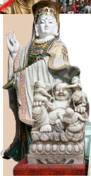
(องค์ BABY BUDDHA)

นำท่านสู่หาดทราย REPULSE BAY หาดทรายรูปจันทร์เสี้ยวแห่งนี้ เป็นแห่งที่สวยงามที่สุดแห่งหนึ่ง และยังใช้เป็นฉากในการถ่ายทำภาพยนตร์หลายเรื่อง มีรูปปั้นของ เจ้าแม่กวนอิม และ เจ้าแม่ทिनโหว่ ซึ่งทำหน้าที่ปกป้องคุ้มครองชาวประมง ให้ท่านนมัสการขอพรจากเจ้าแม่กวนอิม และเทพเจ้าแห่งโชคกลางเพื่อเป็นสิริมงคล ข้ามสะพานต่ออายุ ซึ่งเชื่อกันว่าข้ามหนึ่งครั้งจะมีอายุเพิ่มขึ้น 3 ปี และเป็นสถานที่ ที่นิยมมาขอลูกกับองค์สังกัจจาย (องค์ BABY BUDDHA)