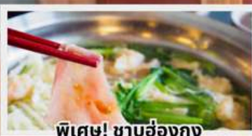
พิเศษ! ซาบูฮ่องกง