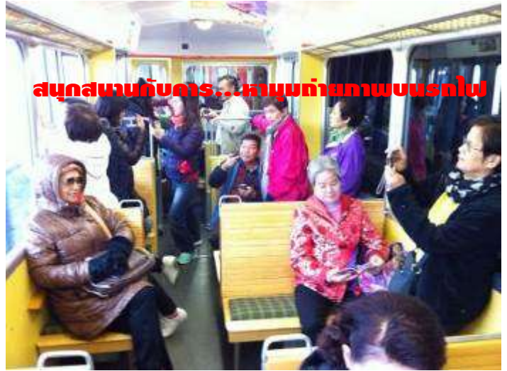
สนุกสนานกับคาร...หาหุ่นถ่ายภาพบนรถไป

อยากสนุกสนาน และประทับใจกันแบบนี้... มาเที่ยวกับเรา: ครีบริบรองไม่ผิดหวัง