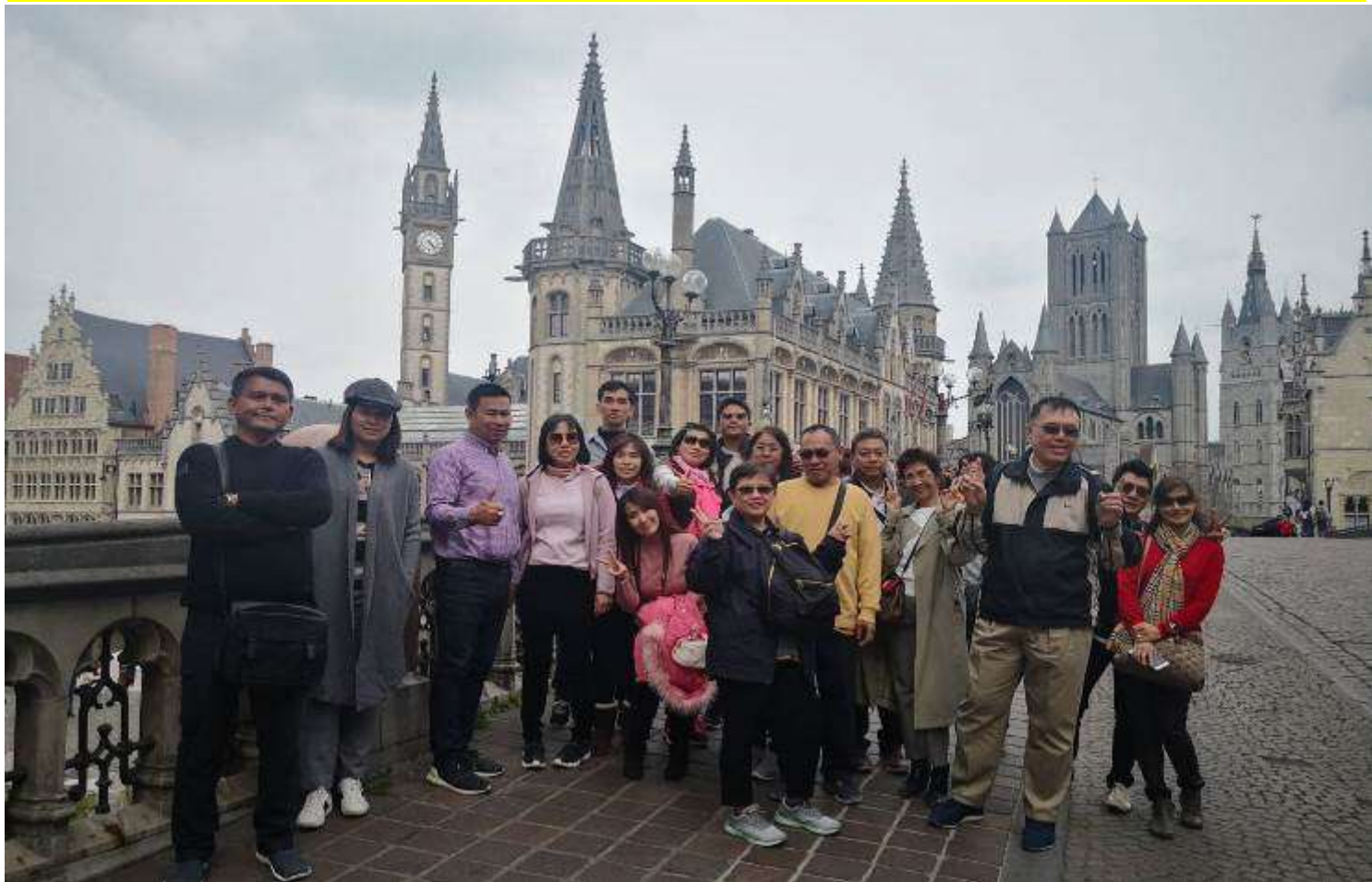
ยุโรปคอนฮอฟ(งานดอกไม้โลก)เยอรมัน เนเธอร์แลนด์ เบลเยียม สภทราด10-17เม.ย.2562 (จำนวน33ท่าน)