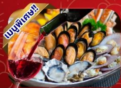
ซีฟู้ดไฮน์แดง