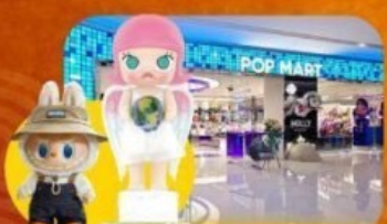
ซ้อปิงจุ่ม POP MART