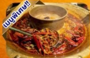
หม้อไฟเสฉวน

พักโรงแรม 4-5 ดาว ฟรี ประกันอุบัติเหตุ บริการ อาหารท้องถิ่น