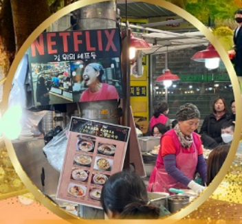
สตรีทฟู้ดตลาดกวางจง