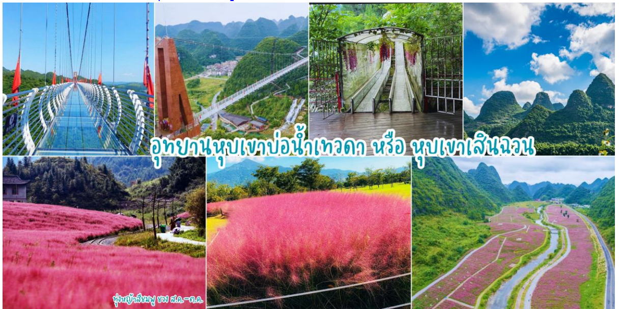
อุทยานหุบเขาบ่อน้ำเทวดา หรือ หุบเขาเสินฉวน

เช้า ๑๐|รับประทานอาหารเช้า ณ ห้องอาหารของโรงแรม หลังอาหารเช้านำท่านเดินทาง อุทยานหุบเขาบ่อน้ำเทวดา หรือ หุบเขาเสินฉวน (ค่ารถแบดเตอร์) มณฑลกุ้ยโจว เป็นแหล่งท่องเที่ยวที่คุณจะได้สัมผัส ดื่มด่ำกับธรรมชาติอย่างแท้จริง และสถานที่แห่งนั้นก็คือ “จุดชมวิวกุ้ยเขาเสินฉวน” เป็นสถานที่ท่องเที่ยวสุด UNSEEN ที่ชื่อเสียงของชาวจีน จุดชมวิวกุ้ยเขาเสินฉวน ตั้งอยู่ท่ามกลางธรรมชาติ ขุนเขา ป่าไม้ ธารน้ำและทุ่งดอกไม้ ที่อุดมสมบูรณ์สวยงาม ในเขตปกครองตนเองชนกลุ่มน้อยเผ่าเหมียวและบู๊อี้ ฉะเหมินหนาน อำเภอฉางชุ่น มณฑลกุ้ยโจวทางตะวันตกเฉียงใต้ของจีน ซึ่งเสน่ห์ที่ชวนดึงดูดให้นักท่องเที่ยวผู้ชื่นชอบธรรมชาติจากทั่วทุกสารทิศอยากจะมาเยือนที่จุดชมวิวกุ้ยเขาเสินฉวนแห่งนี้ นำท่านชมบ่อน้ำเทวดา ลักษณะเป็นบ่อน้ำพลูร้อนที่เกิดขึ้นตามธรรมชาติ เป็นสถานที่ที่ชาวกุ้ยโกวนิยมมาขอพรให้กิจการการงานราบรื่น จากนั้นนำท่านชมวิวกุ้ยเขาที่หยอด โดยสัมผัสความหวาดเสียว ณ สะพานกระจกหุบเขาน้ำพลูเทวดา (รวมค่าบัตรเดินรถไฟเที่ยว) สะพานแก้วมีความยาว 324 เมตร สูง 188 เมตร ให้ท่านได้ชมวิวดงงามด้วยยอดเขาที่หนาแน่นและแปลกตาและภาพรวมที่สมบูรณ์แบบ รูปร่าง ได้รับการยกย่องจากผู้เชี่ยวชาญและนักท่องเที่ยวมากมายว่าเป็น “สิ่งมหัศจรรย์ของโลก” นำท่านชมทุ่งดอกไม้ตามฤดูกาลที่มีความสวยงามแฉะถ้าयरูปตามจุดชมวิวกุ้ยเขา (ในช่วงเดือน พ.ค.-ส.ค.67 ท่านจะได้ชมทุ่งทานตะวันหรือดอกไม้อื่นๆ // ในช่วงปลายส.ค.-ต.ค.67ท่านจะได้ชมทุ่งหญ้าสีชมพู)