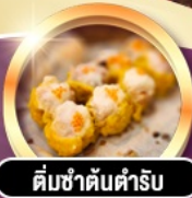
ต้มซ่าตันตำรับ