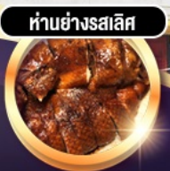
हांอย่างรสเลิศ