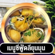
เมนูซีฟู้ดลิ้นมดุน