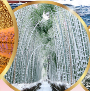
ป่าไฟ อาราชิมายา